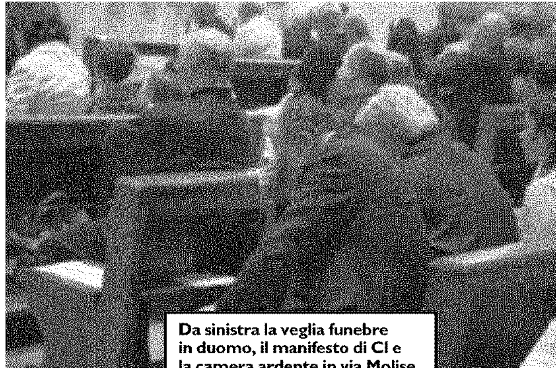
Da sinistra la veglia funebre in duomo, il manifesto di C1 e la camera ardente in via Molise