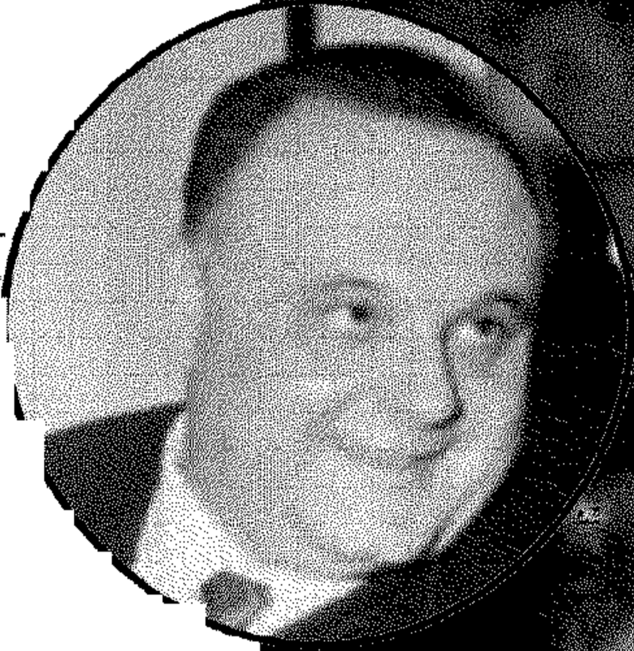
Nella foto grande il premier dopo la vile aggressione subita a Milano. Nel riquadro in alto il sindaco Walter Ceccaroni, ferito da un falegname con un punteruolo nel 1967. Sotto l'attuale sindaco Alberto Ravaoli, aggredito da due giovani che giocavano a palla in piazza mentre pranzava in un bar